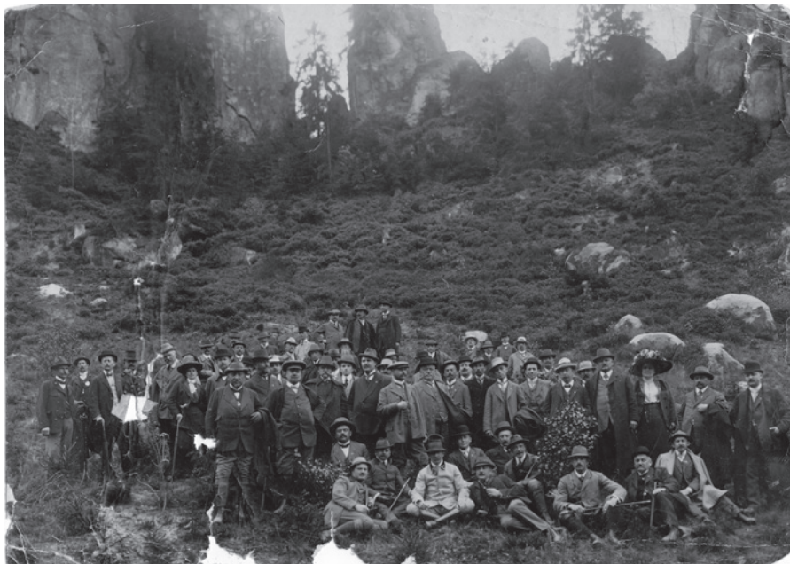
Sjezd Českých rybářů. Před 1. sv. válkou.