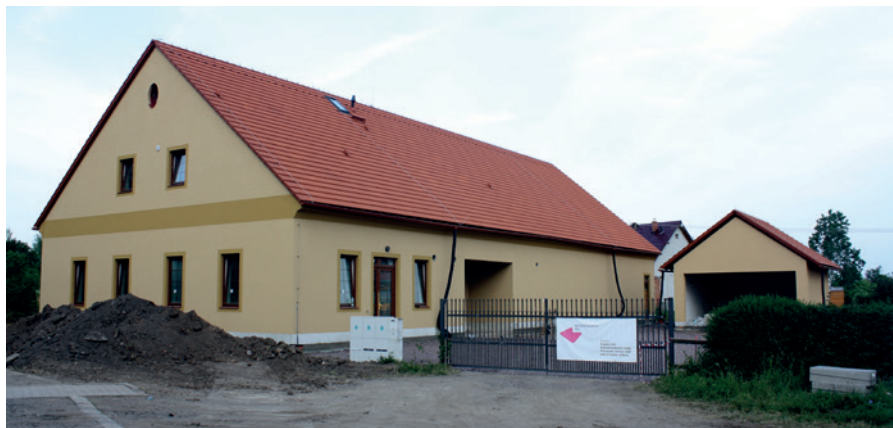
Doba stěhování našich muzejních sbírek do nového depozitáře se blíží.