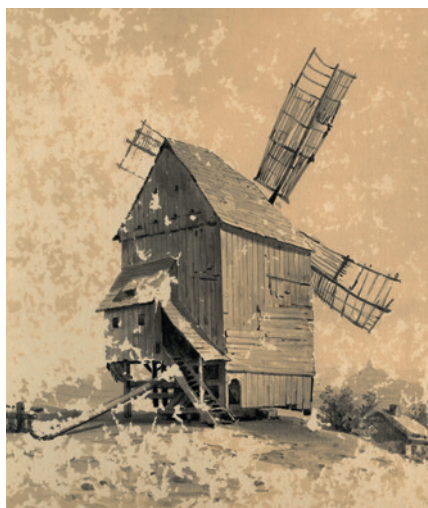
Karel Liebscher, Větrník na Veliši, 1884, akvarel (Sbírka RMaG v Jičíně).

Sbírkový materiál muzea zahrnuje mnoho zajímavých předmětů, součástí jsou také modely různých staveb z vesnického i městského prostředí. Tvorba modelů představovala jeden ze základních způsobů dokumentace lidového stavitelství, některé z nich jsou dokonce funkční. Mnohé modely byly vytvořeny podle reálných staveb, podle fotografií či stavebně technické dokumentace a řada z nich v reálném prostředí již zanikla, proto jsou významným dokladem jejich existence.