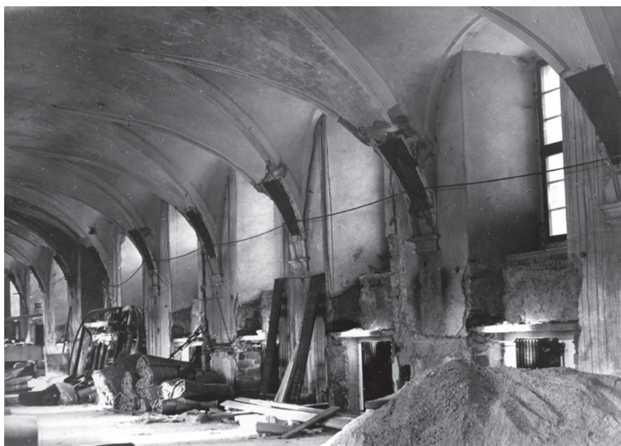
Jičín, zámek, budoucí prostor galerie, listopad 1973.