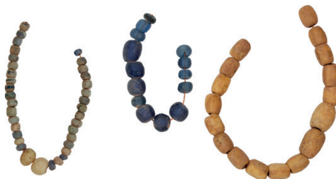
Růžence byly obvyklým předmětem v rituálech spojených s umíráním a většina medailonků a křížků tvořila jejich součást.