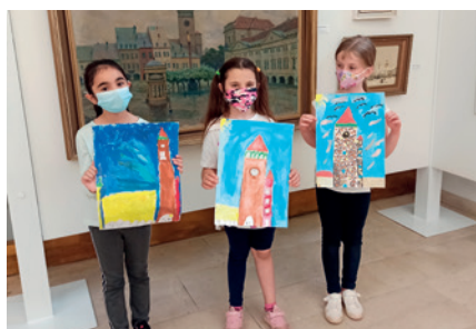
Jičín pohledem dětí.