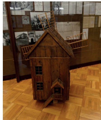
Model větrného mlýna v expozici jičínského muzea.