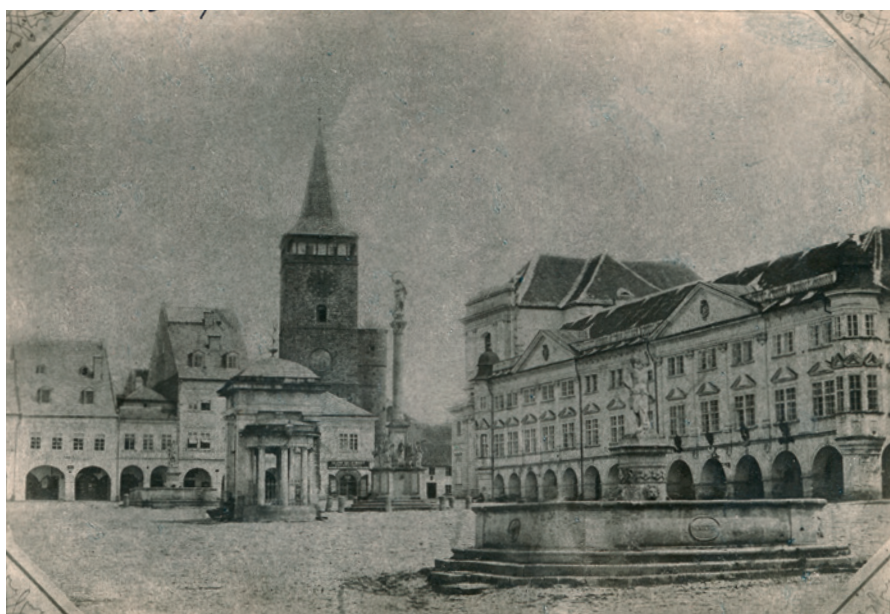
Velké náměstí před rokem 1880. Neptunova kašna se nachází ještě v původní poloze, kopie (Sbírka RMaG v Jičíně).