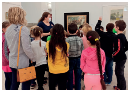
Komentovaná prohlídka výstavy Jičínsko očima výtvarníků.