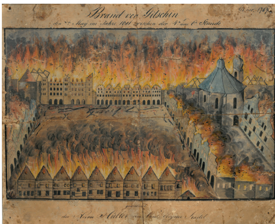
Neznámý autor, Město Jičín plamenem hoří, kolorovaná kresba, 228 × 353 mm.

Po smrti Albrechta z Valdštejna se novým majitelem kumburského panství s městem Jičínem stal roku 1635 Rudolf z Tiefenba-