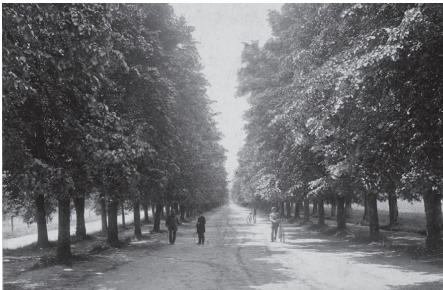
Cyklisté v lipové aleji (Sbírka RMaG v Jičíně).