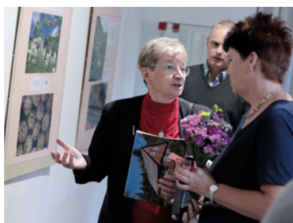
Vernisáž výstavy Jak semena putují krajinou.