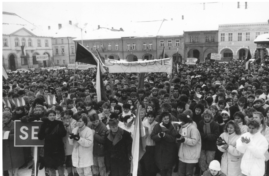
Generální stávka v Jičíně, 27. 11. 1989 (Sbírka RMaG v Jičíně).

Výstavu můžete navštívit od 1. listopadu do 1. prosince 2019 ve výstavní chodbě muzea. Vernisáž výstavy se koná 31. listopadu 2019 v 17. hodin.