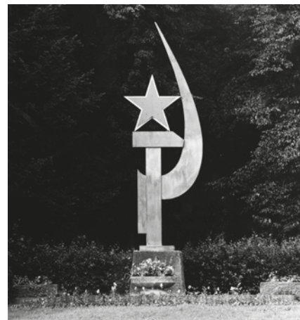
Skulptura srpů a kladiva, foto Josef Knopp, červen 1974. (Sbírka RMaG v Jičíně).

U příležitosti 20. výročí vyzdvižení Smírčího kříže na hřbetu Veliše a tzv. Jičínského apelu se konala ve dnech 13.–14. 9. slavnost s názvem Smír, krajina a my. Jičínské muzeum se stalo partnerem a vytvořilo zázemí pro jednotlivé akce. První setkání se konalo v kostele sv. Jakuba, kde byl připraven varhanní koncert. Hned poté se lidé nevšedním průchodem skrz kostel sv. Jakuba a muzeum dostali do porotního sálu, kde probíhala debata u kulatého stolu. Studenti jičínského gymnázia diskutovali s veřejností a významnými hosty o smyslu doby, smíření.