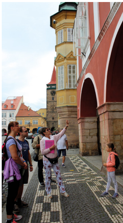
Prohlídky města v letních měsících pořádané jičínským muzeem.