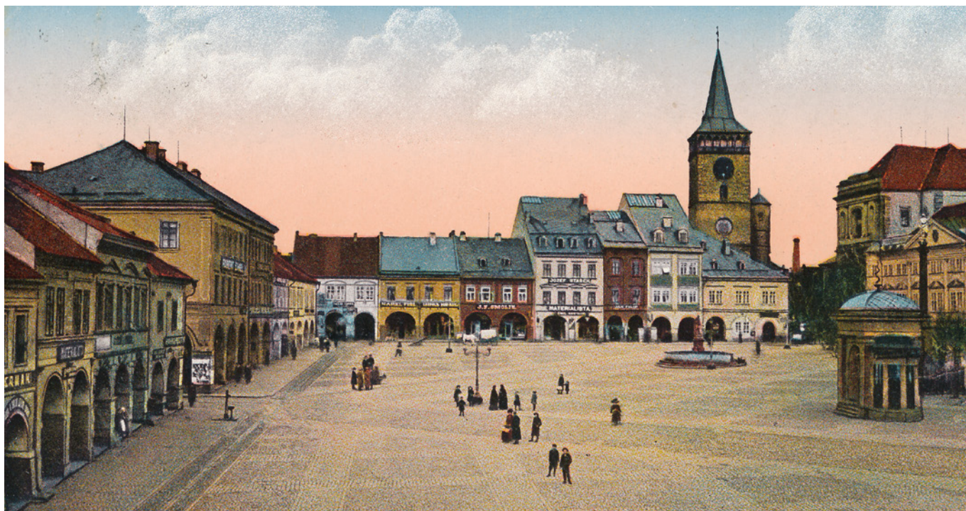
Valdštejnová náměstí – východní strana, kolem 1910.