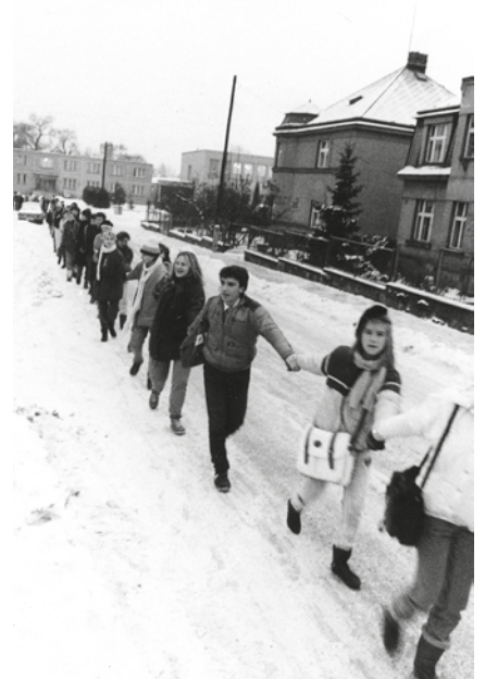
„Živý řetěz“ studentů vedoucí na místo tragédie ze září 1968, 26. 11. 1989.

Nejdůležitějším momentem u takto nové historie jsou samozřejmě vzpomínky pamětníků, které velmi obohatí celou výstavu, protože osobní zážitky na tuto dobu jsou u mnohých z nás stále ještě velmi silné, o to více, když se jedná o tak důležitou událost, jakou byla sametová revoluce.