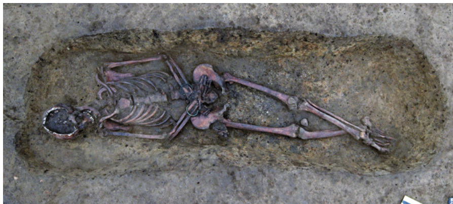
Kopidlno (okr. Jičín). Objekt 520.