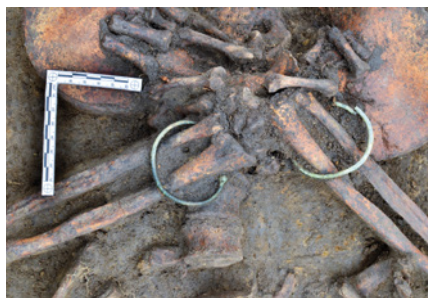
Kopidlno (okr. Jičín). Detail bronzových náramků in-situ.