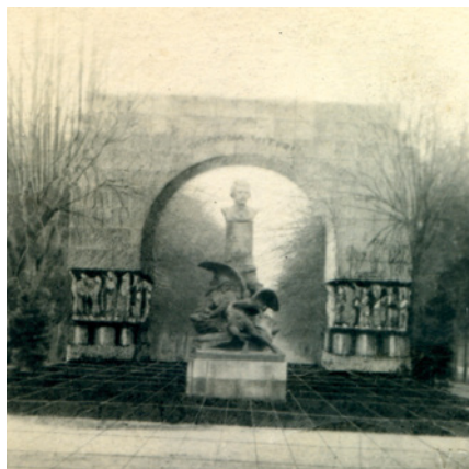
Návrh pomníku Vítězství v Jičíně, 1. republika (Sbírka RMaG v Jičíně).