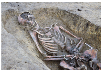
Kopidlno (okr. Jičín). Detailní pohled na horní polovinu těla keltské ženy.