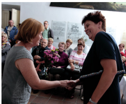
Vernisáž výstavy Jak semena putují krajinou.