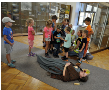
Naše archeoložky v akci při ukázce průběhu pravěkého pohřbu pro děti z příměstského tábora K-klubu.