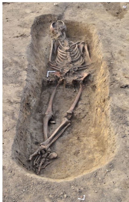
Kopidlno (okr. Jičín). Objekt 520, fotografická dokumentace hrobové jámy s kosterními pozůstatky.