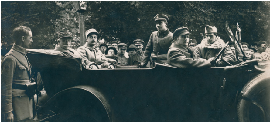
Generál Pellé v Jičíně, 7. 10. 1919