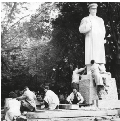
Postavení Stalinovy sochy na sokl, 11. 9. 1952.