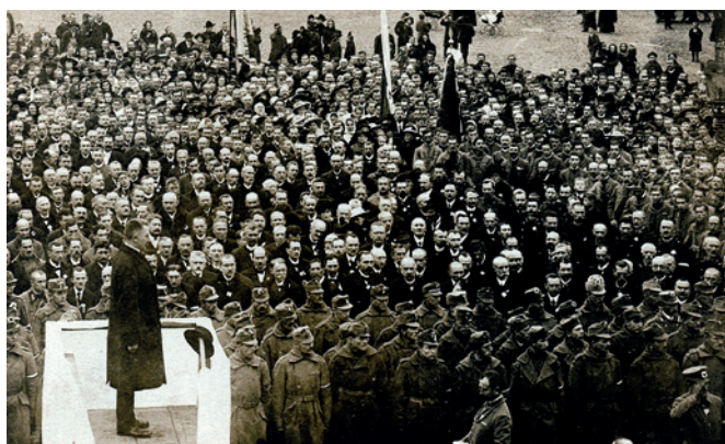
Přísaha občanů a vojska nově vzniklému Československému státu na Velkém náměstí v Jičíně, 8. 11. 1918.