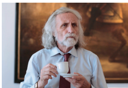
Foto z nového muzejního videospotu.