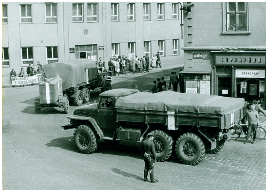
Vozidla okupační armády kolem rohového domu č. p. 39 na Husově ulici, foto Josef Knopp (Sbírka RMaG v Jičíně).

V roce 1918 byl hybnou silou ve městě Sokol, v roce 1938 vířilo události hlášení celostátního rozhlasu, které v ulicích poslouchaly stovky obyvatel města. Nejvýraznější a nejvážnější změnou pro rok 1948 byl vznik akčních výborů, které naprosto změnily ráz úřadů, organizací,