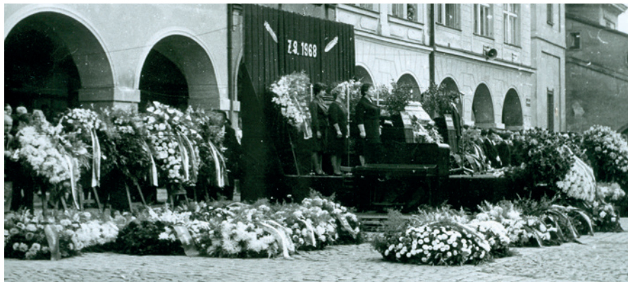
Katafalk s rakvemi.

studentů, směřující ke kasárnám v Lipách. Podobnou atmosféru zažilo město a především náměstí i 22. září. Mnohé protesty i mobilizace vyhlášená 23. září 1938 ale nezabránily událostem, které spustila Mnichovská dohoda z 29. září 1938.