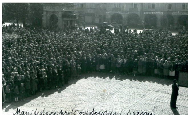
Jedna z řady manifestací za celistvost republiky proti odstoupení území, 22. 9. 1938.