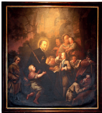
Sv. František Regis, 1757, olej, plátno, 217 x 195 cm (Sbírka RMaG v Jičíně)