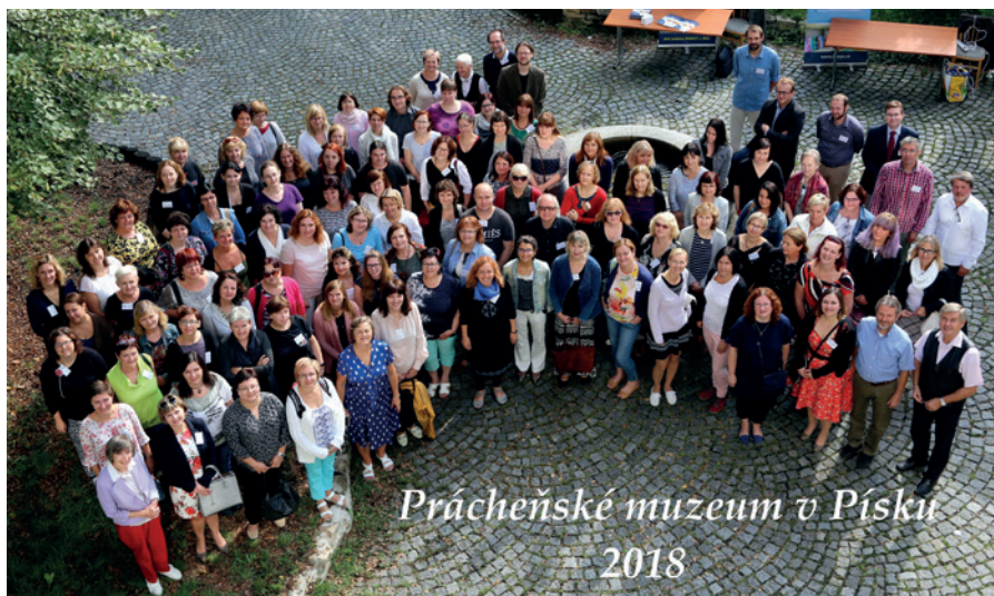
Skupinové foto účastníků zájmového knihovnického semináře Asociace muzeí a galerií ČR v Písku.

HURÁ, MUZEUM! Čtvrtletník Regionálního muzea a galerie v Jičíně 4|2018