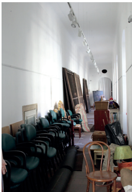
Z důvodu restaurování oken na čelní straně zámku se z výstavní chodby muzea stalo na čas skladiště.