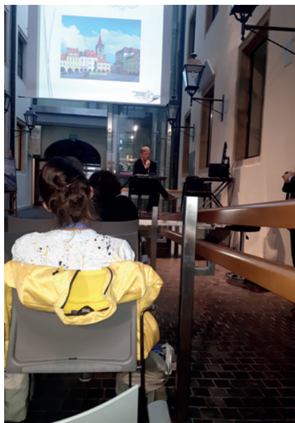
Mezinárodní konference ve Wroclavi na téma muzejní edukace, jejímž partnerem bylo i jičínské muzeum.