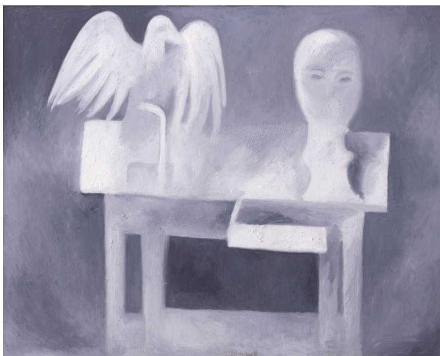
Vladimír Komárek, Hlava a pták, 1965, olej, plátno, 80 x 100 cm (Sbírka RMaG v Jičíně).

Výstavu můžete navštívit od 23. listopadu 2018 do 6. ledna 2019 v zámecké galerii.