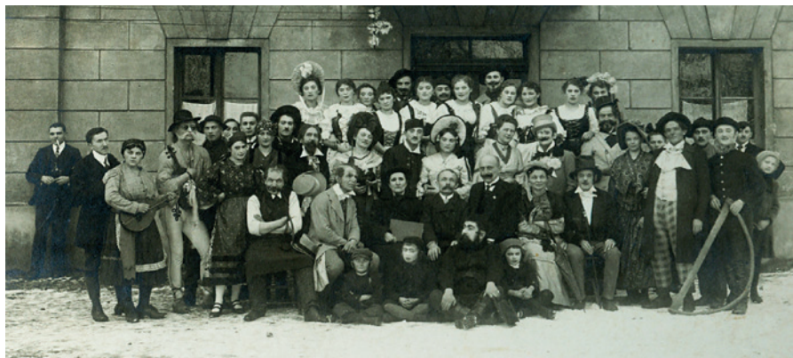
Fotografie herců z představení Fidlovačka, prosinec 1918.