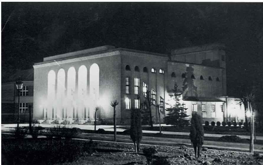
Bio Český ráj, pohlednice, nedatováno (Sbírka RMaG v Jičíně).