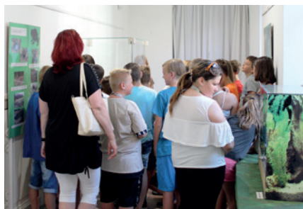
Komentovaná prohlídka výstavy Pozor, žábý!