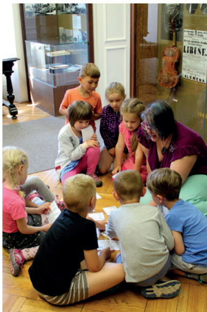
Edukační program pro děti z mateřských škol.