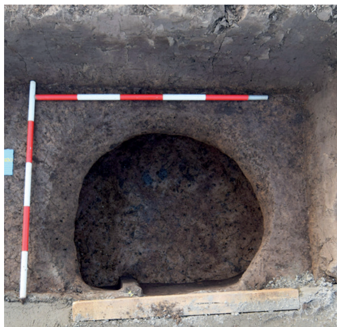
obr. 3: Vitiněves, zásobní jáma lužické kultury – pohled shora. Nález z roku 2018.