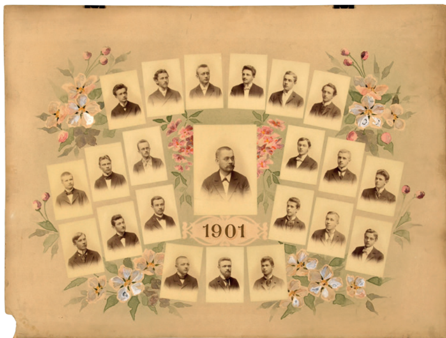
Tablo abiturientů Vyššího gymnasia v Truhlářské ulici v Praze z roku 1901 (Sbírka Národního pedagogického muzea a knihovny J. A. Komenského).

Na výstavu se můžete přijít podívat od 5. října do 25. listopadu 2018 ve výstavní chodbě muzea.