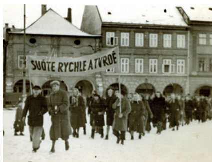
Události únorových dní v Jičíně (Sbírka RMaG v Jičíně).