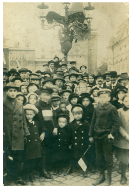
„Přeložení“ rakouských orlů na „kandelábr“, Velké (Valdštejnovo) náměstí, říjen 1918.

Výstavu můžete navštívit od 15. června do 23. září 2018 ve výstavní chodbě muzea.