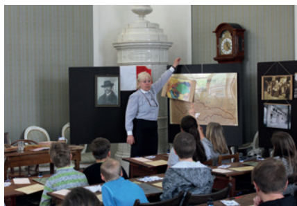
Edukační program Ze školních lavic – příběhy první republiky.