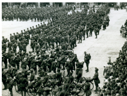
Vítání záložníků 22. Argonského pluku po jejich návratu z hraničního pásma, 14. 6. 1938 (SOKA Jičín, Archiv města Jičína, Přílohy ke kronice 1938, kart. 190, inv. č. 816).