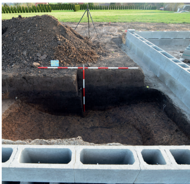
obr. 1: Vitiněves, zahloubený objekt kultury s vypíchanou keramikou překrytý pravěkou kulturní vrstvou. Nález z roku 2018.