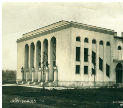
Bio Český ráj, pohlednice, 1925.

V létě 1931 se Bio Český ráj přizpůsobilo novým požadavkům a vymoženostem na poli filmové techniky. V kině bylo nainstalováno zařízení k promítání zvukových filmů. Družstvo legionářů vybíralo vhodné stroje a konečný výsledek podpořila samozřejmě i výborná akustika sálu. Nejednalo se o nouzové doplňovací vybavení, ale skutečně o nový promítací stroj zařízený na produkci všeho druhu. Reprodukory byly umístěny za plátnem, čímž zvuk vycházel přímo z obrazu. Montáž nového