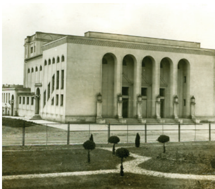
Bio Český ráj, 30. léta 20. stol.