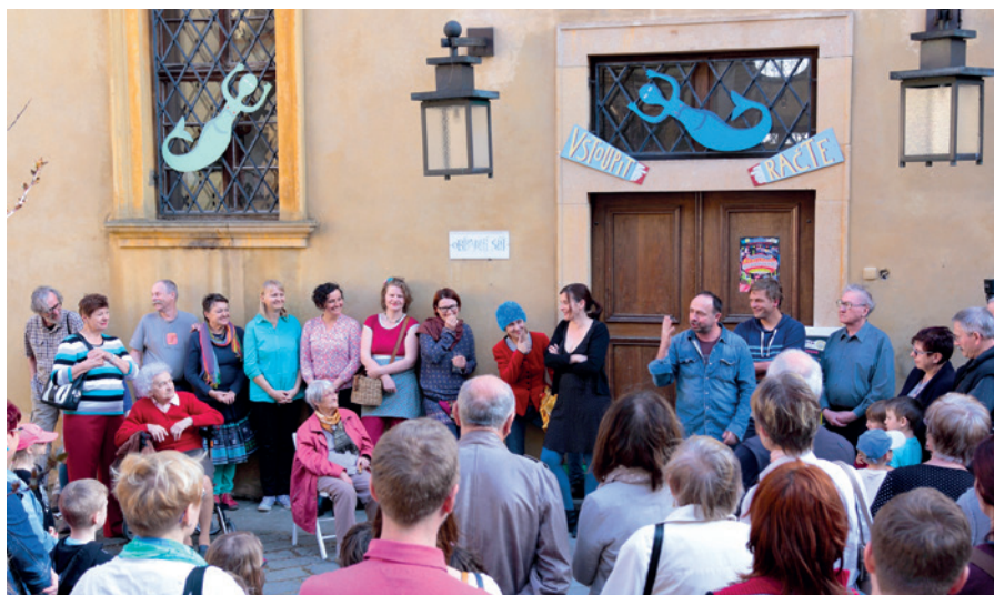
Vernisáž výstavy Konírna imaginární.

HURÁ, MUZEUM! Čtvrtletník Regionálního muzea a galerie v Jičíně 3|2018