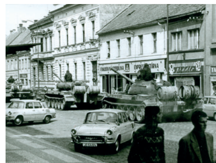
Husova ulice v srpnu 1968.