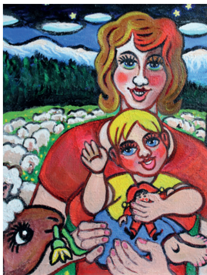
Horalka, Břetislav Kužel, olej na plátně, 80 x 70 cm.

Výstavu můžete navštívit od 28. září do 8. listopadu 2018 v zámecké galerii.