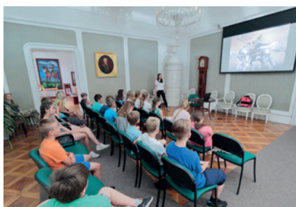
Edukační program Koníny v muzeu pro žáky základních škol.