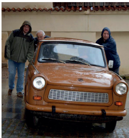
První exponáty na výstavu Můj život s Trabantem míří do galerie.