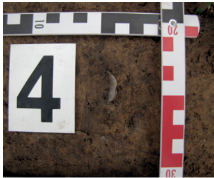
Nálezová situace jednoho z mnoha silicitových úštěpků ve spraši.

Další indicií svědčící o vysokém stáří nálezů je jejich pozice v půdních vrstvách. Nacházely se pod spodní neporušenou hranicí holocenních půd ve svrchní vrstvě spraše. Spraš je prachová zemina typicky světle okrové barvy, navátá větrem. Spraše vznikaly v dobách ledových, kdy probíhalo silné mrazové zvětvování hornin až na prach. Ten byl unášen větrem na velké