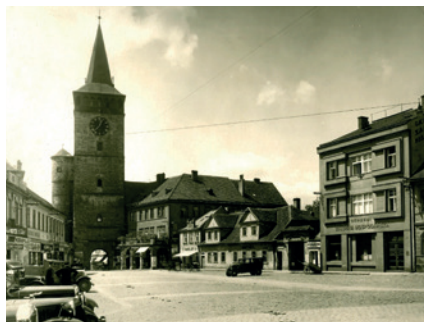
Žižkovo náměstí, před rokem 1937. Sbírká RMaG v Jičíně.