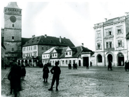
Kopie fotografie ze staršího negativu