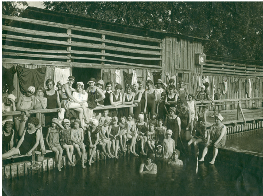
Jičínská plovárna, přelom 19. a 20. století, foto A. Brožek. Sběrka RMaG v Jičíně.