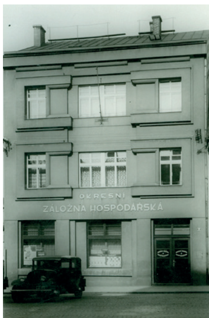
Budova Okresní hospodářské záložny, po 1928.