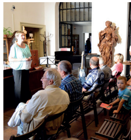
Vernisáž výstavy Čas rychlých kol a vůně benzínu – Cena Prachovských skal .