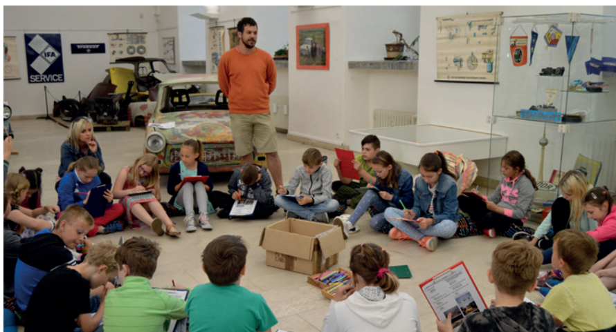
Děti luští zásluný test trabantistických vědomostí v rámci komentované prohlídky výstavy Můj život s Trabantem .