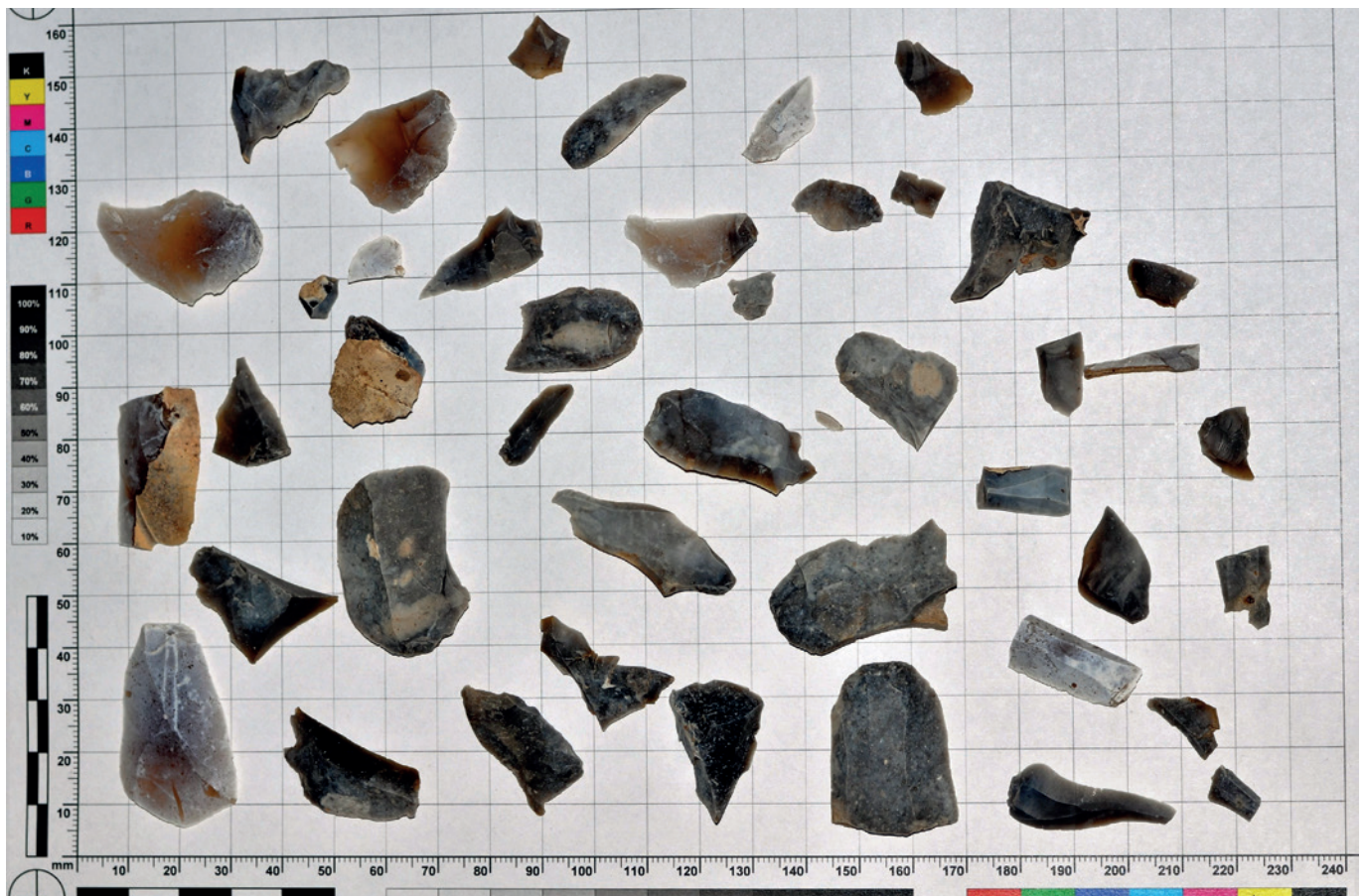
Slatinky, okr. Jičín. Náhodný výběr ze souboru kamenné štípané industrie.