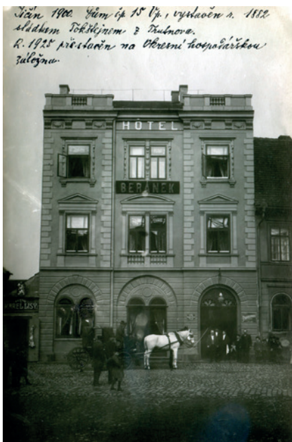
Hotel Beránek, počátek 20. století.