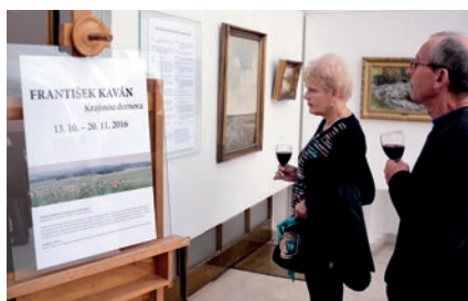
Vernisáž výstavy František Kaván – Krajinou domova .