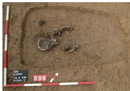
Obr. 5 Hrob č. 596

byla nalezena mísa a uvnitř ještě džbáněk. Dle polohy těla usuzujeme, že se jedná o ženu. Nedaleko, opět v ose hrobu, byl zjištěn hrob č. 529 (obr. 4) s dobře zachovalou kostrou, který přisuzujeme opět ženě. Bohatou pohřební výbavu v podobě džbáněčků a konvice měla pohřbená vložena za zády.