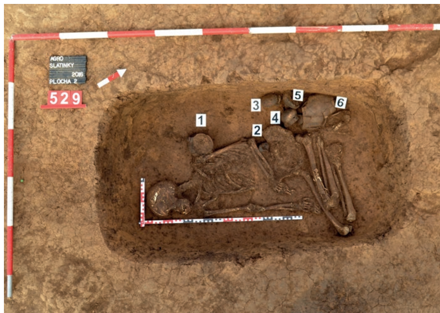
Obr. 4 Hrob č. 529