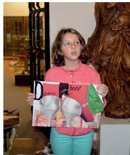
Program pro školy Plakát jako fenomén doby k výstavě Zlatá éra českého filmového plakátu .