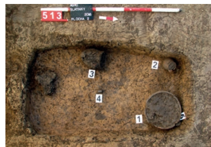
Obr. 1 Hrob č. 513