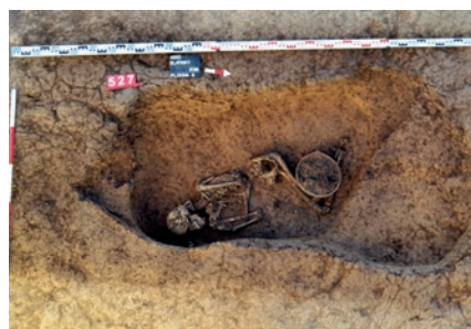
Obr. 3 Hrob č. 527.

Téměř kompletní kostra se zachovala v hrobě označeném č. 527 (obr. 3). Zde bylo tělo opět ve skrčené poloze položeno na pravý bok, hlavou k jihu. V klínu mezi stehenními kostmi a kostmi bérců