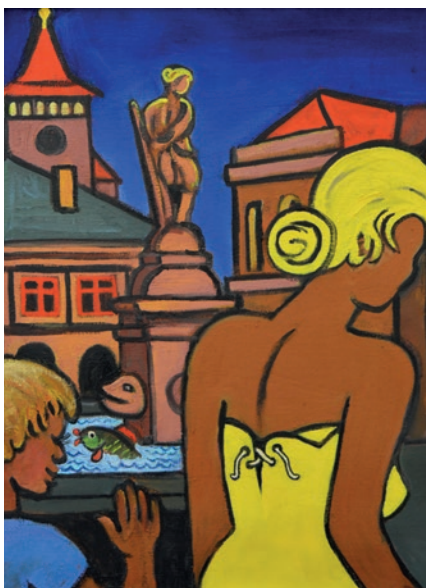
Břetislav Kužel, Duo Drdolos, 2016, olej, plátno, 80 x 70 cm.

Výstava se koná ve výstavní chodbě muzea od 20. ledna do 26. února 2017.