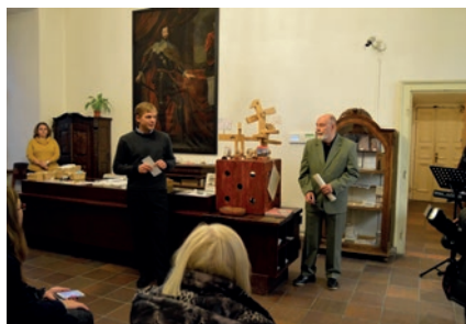
Vernisáž výstavy Zlatá éra českého filmového plakátu .