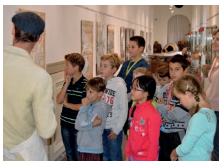
Teoretická a praktická část programu k výstavě Jeden den ve středověku očima hrnčíře východočeského městečka .

Svého edukačního programu se dočkala i podzimní výstava malíře a básníka Františka Kavána, kterého jsme si v letošním roce připomněli u příležitosti oslav jeho dvojitého jubilea. Doprovodný program k výstavě František Kaván – Krajinou domova navštívil přes 180 dětí ze základních a mateřských škol. Komentovaná prohlídka pomohla žákům proniknout do nitra Kavánových náladových krajin a poznat jejich nadčasovou krásu. Děti se seznámily s autorovým životem a tvorbou a na závěr si v rámci aktivizační činnosti vyzkoušely vlastní originální tvorbu podle zvolených obrazů Kavánovy krajiny.