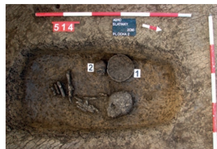
Obr. 2 Hrob č. 514