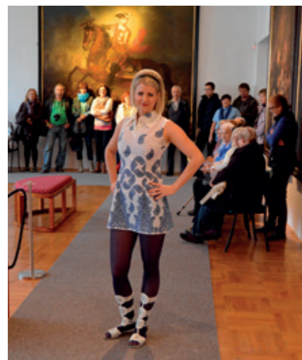
Caffé Muzeum: retro módní přehlídka