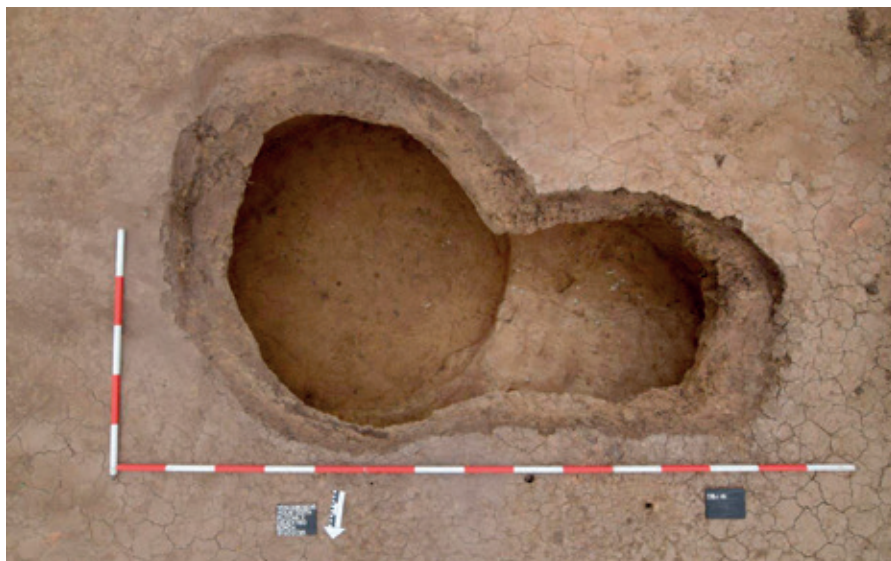
Vršče. Pohled shora na superpozici dvou zásobních jam z mladší doby bronzové.