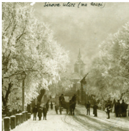
Širová ulice (dnešní Ruská), před 1914.