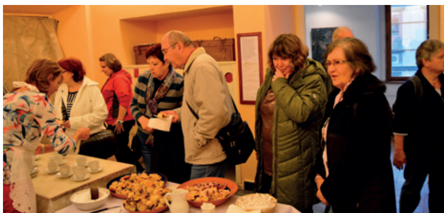
Caffé Muzeum: muzejní kavárna