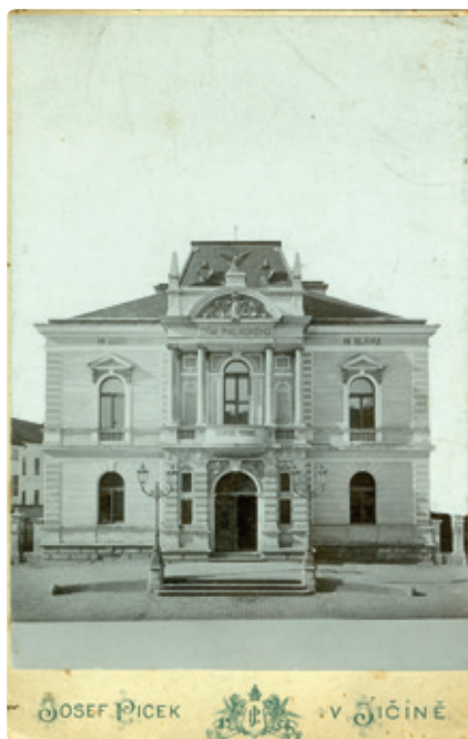
Budova Domu Palackého po její dostavbě, foto Josef Picek, po roce 1896 (Sbírka RMaG v Jičíně).

Většina prací byla zadána jičínským živnostníkům, členům Sokola.