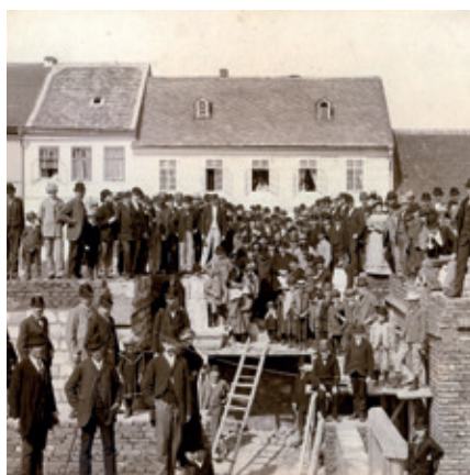
Položení základního kamene jičínské sokolovny – Domu Palackého dne 15. 4. 1894.