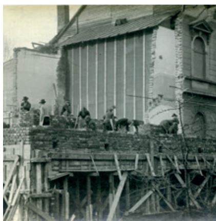
Přestavba sokolovny v roce 1926, zadní stěna budovy k jevišti (SOKA Jičín, fond TJ Sokol Jičín, kart. 2.).