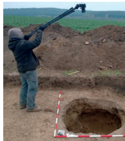
Vršče. Dokumentace vypreparované zásobní jámy z mladší doby bronzové.