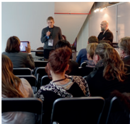
Fotografie z vyhlášení cen v Paříži