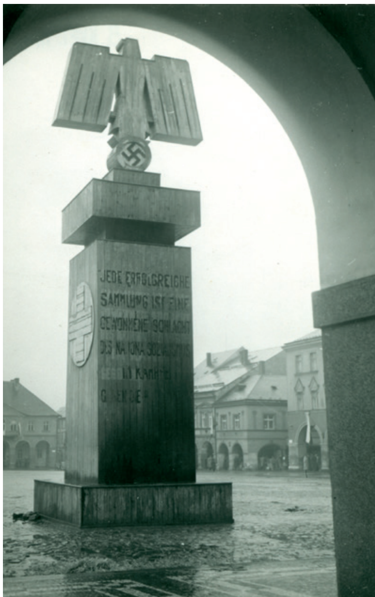
Pomník Zimní pomoci na Valdštejnově náměstí.