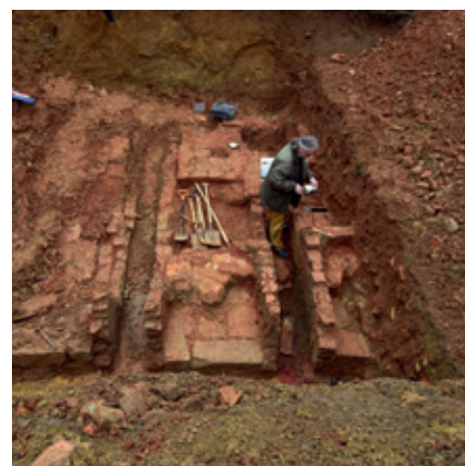
Odebírání vzorku pece ve Šlikově Vsi pro archeomagnetické datování pro určení posledního výpalu v peci.