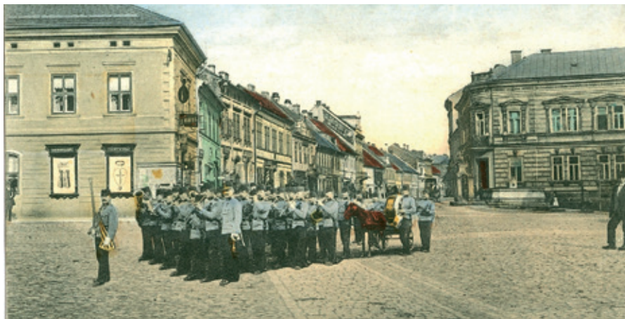
Vojenská posádka na Žižkově náměstí na pohlednici z doby 1. světové války.

V roce 1915 byly v novinách často vydávány pokyny a výzvy k úspornému vaření, topení a svícení: Kterak má obyvatelstvo žít se za války, Jak šetřit zásob mouky, Návody, jak vařit či Praktické pokyny, kterak upotřebit zbytků a odpadků jídel v domácnosti . • 7. dubna se konalo zahajovací představení Činoherní divadelní společnosti A. Havlíčkové-Konětopské v hotelu Hamburk s názvem Chocholouš, aneb Děvče z továrny od Wildenbrucha. Společnost v Jičíně s úspěchem hrála celý měsíc. • Místní hudební spolek pořádal 8. dubna koncert ve prospěch vojínů-invalidů a jejich rodin. • Dne 11. dubna byly odcizeny z domu truhláře soukenné kalhoty v ceně 20 K i s obnosem 10 K v kapse. Poberta byl přistižen a zadržen majitelem kalhot, právě přicházejícím domů, který ho předal policii. • V dubnu byl zadržen v Radimí ruský zběh z husarského pluku v Karpatech. Měl v úmyslu pokračovat z Radimí za sestrou do Itálie. • 11. května byl u rolníka ve Lhání při bílení domku objeven skrytý poklad 179 starých stříbrných mincí o váze 2 kg