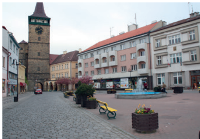
Dnešní podoba Žižkova náměstí.