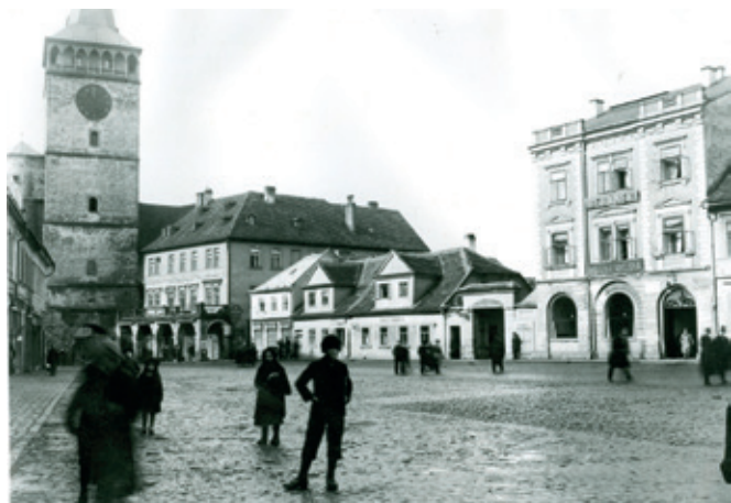
Žižkovo náměstí po roce 1912, kopie, kterou zhotovil arch. Zdeněk Musil z neznámého originálu.