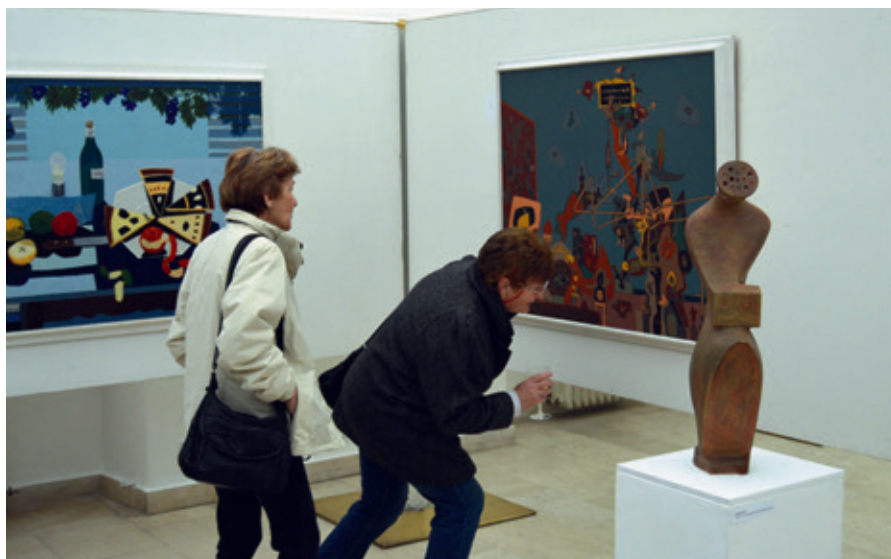
Vernisáž výstavy Poklady sbírek II.

HURÁ, MUZEUM! Čtvrtletník Regionálního muzea a galerie v Jičíně 2|2015