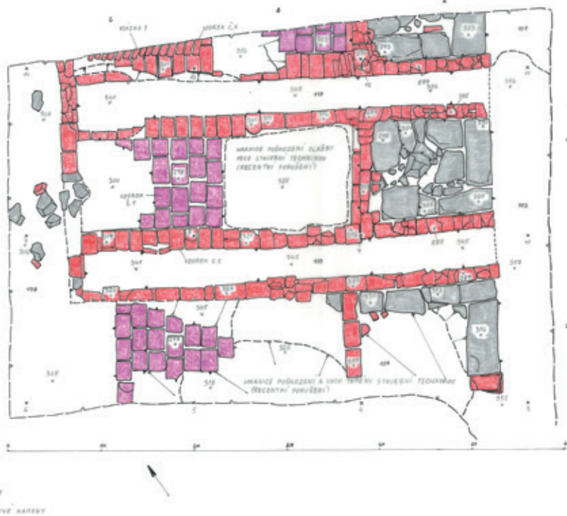
Kresebná dokumentace podlahy komory pece s dobře patrnými topnými kanály a základy kamenných pilířů. Při severovýchodním okraji se patrně zachovala část poslední vsázky cihel.

Při pečlivém odkryvu destrukce bylo brzy zřejmé, že se nejedná o běžnou stavbu. V první řadě nás upoutala přítomnost velkého množství hrudek žarem propálené hlíny a zlomků cihel. Po té, co jsme odkryli podlahu stavby, opatřenou souběžnými kanály, bylo zřejmé, že máme co do činění s cihlářskou pecí. Jedná se o typ žárové pece, minimálně se třemi topnými kanály; přesný počet topných kanálů neznáme, nebyly všechny odkryty. Vzhledem k přítomnosti kamenných pilířů můžeme tvrdit, že se jednalo o klenutou pec zapuštěnou pod povrch terénu. Domníváme se také, že pec mohla mít dvě vypalovací komory. Lze tak usuzovat z protáhlého tvaru stavby na zmíněné mapě. Produkce takové cihelny mohla dosáhnout více než 320 tisíc cihel ročně. Nelze vyloučit, že cihelna na tomto