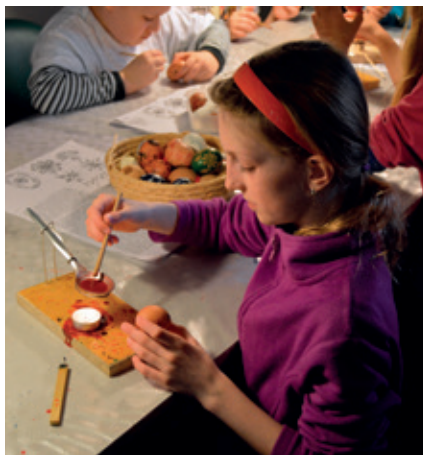
Zdobení vajec technikou reliéfní malby horkým včelím voskem obarveným voskovkami.