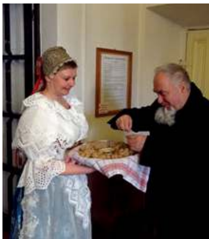
Vernisáž výstavy Zakrojte si u nás aneb příběh chleba.