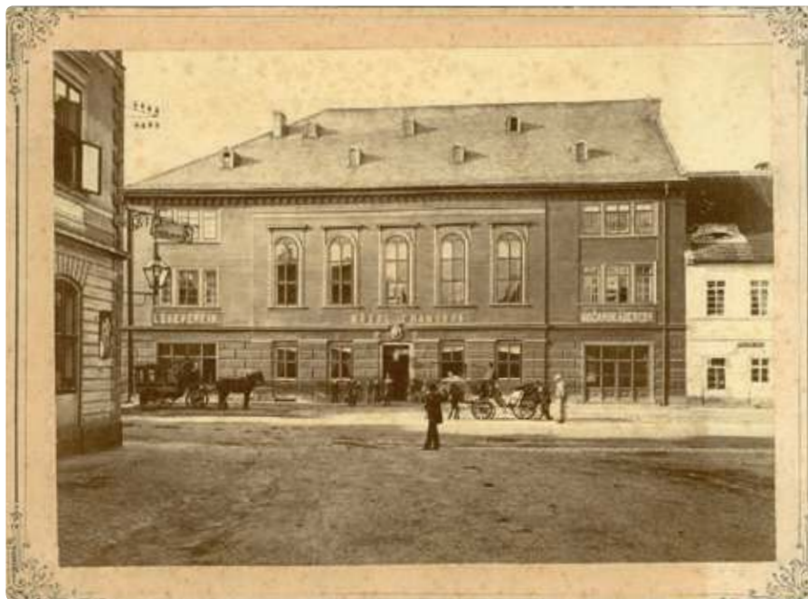
Nejstarší snímek hotelu U města Hamburku, před 1883.