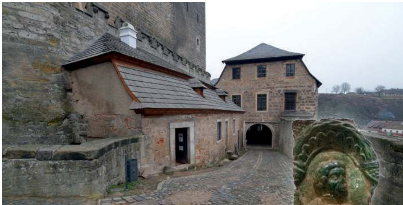
Budova čeledníku v pohledu od jihovýchodu. V pozadí Lohkovický palác s průjezdem.