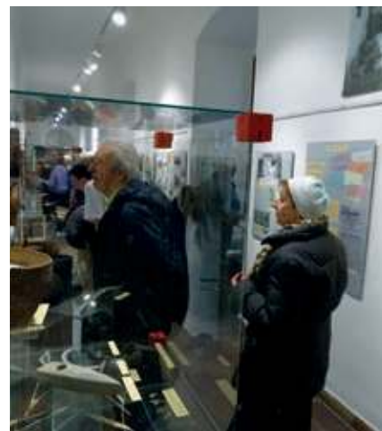
Vernisáž výstavy Zakrojte si u nás aneb příběh chleba.